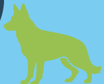
Nifer o ymweliadau: